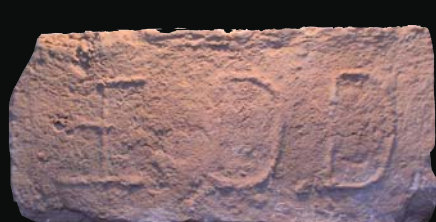
1. kép: domború AEDD (Archiepiscopus Dominium Drégelyensis?)