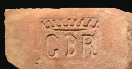
9. kép: mélyítésben mélyített GBD + korona (gróf Berchtold Richárd)