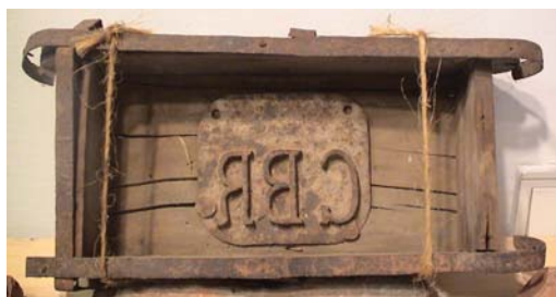
4. ábra: Gr. Berchtold Richárd téglavető sablonja

A téglavető sablonja a 4. ábrán látható. Gróf Berchtold Miklós mélyített GBM betűkkel és grófi koronával (13. kép), gróf Berchtold Charlotte pedig ugyancsak mélyített GBC betűkkel és grófi koronával jelzett téglabélyeget használt (14. kép).