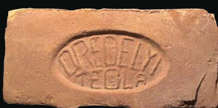
24. kép: mélyítésben domború Drégelyi Tégla felirat