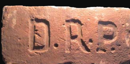
21. kép: mélyített DRP (Drégelypalánk)