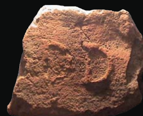
6. kép: domború ?DD (ismeretlen)