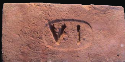
25. kép: mélyítésben mélyített VI (ismeretlen)