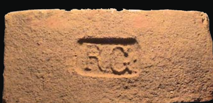
17. kép: mélyítésben domború RG (Renner Gáspár)