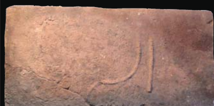
30. kép: domború IS ? (ismeretlen)