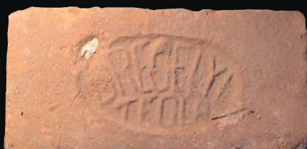
23. kép: mélyítésben domború Drégelyi Tégla felirat