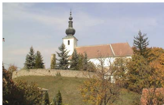
1. ábra: Nagyboldogasszony katolikus templom Bernecebarátiban

A Nagyboldogasszony római katolikus templomot (1. ábra) a fellelhető adatok szerint a XII.-XIII. században emelték, majd a XVIII. és XIX. században több ízben is átépítet-