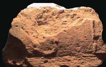
7. kép: domború GE (ismeretlen)