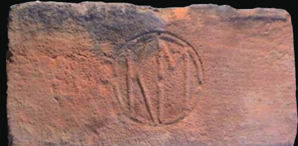
26. kép: mélyítésben domború KM (ismeretlen)