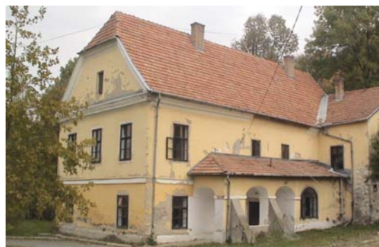
2. ábra: A Huszár kastély napjainkban

A baráthi Huszár család kastélyát a XVIII. században építették barokk stílusban (2. ábra). Az épület Huszár Ida házasságával az Okolicsányi család tulajdonába került. 7 Az egyemeletes műemlék jellegű épület téglalap alaprajzú. Földszinti részén 3 nyílásos tornác áll, melyet támpillér támaszt. Az épület végéhez szárnyrész kapcsolódik. 8 Az épület környezetében talált téglák nagy része jelöletlen nagyméretű, de találtunk olyan ovális mélyítéssel is, melyben egyéb jelölés nem volt (4. kép). A jelzettek közül ismertek a jelen kötet „Ipolyság téglagyárosai a XIX-XX. században” című fejezetében is taglalt EM (Engelhardt Mihály), WSF (Winter Sándor és Fiai) és H (Holczer) monogramosak, ismeretlen viszont a ZG feliratú darab (5. kép).