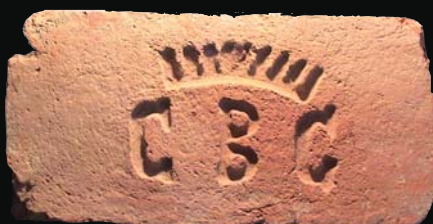
14. kép: mélyített GBC + korona (gróf Berchtold Charlotte)