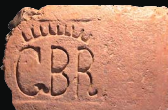
8. kép: mélyítésben mélyített GBD + korona (gróf Berchtold Richárd)