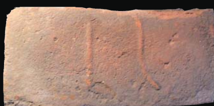
28. kép: domború IS (ismeretlen)