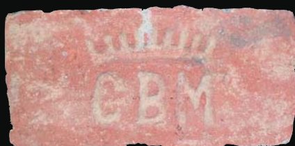
13. kép: mélyített GBM + korona (gróf Berchtold Miklós)