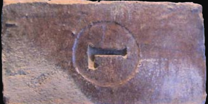
27. kép: mélyítésben mélyített L (ismeretlen)