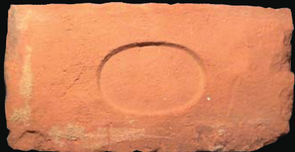
4. kép: mélyített ovális ablak