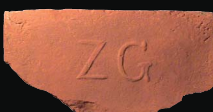
5. kép: domború ZG (ismeretlen)