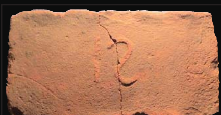
29. kép: domború IS (ismeretlen)