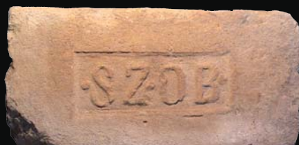
20. kép: mélyítésben domború SZOB (Drégelypalánk)