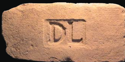
16. kép: mélyítésben mélyített DL (Darányi László)