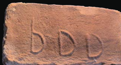
2. kép: domború BDD (Bernece Dominium Dregelyensis?)