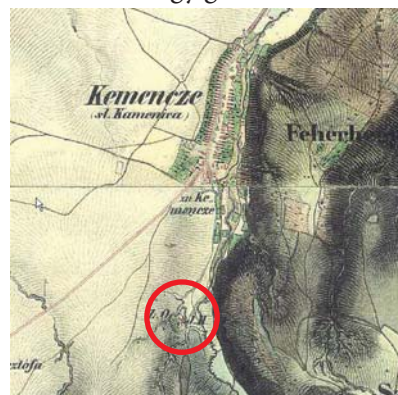
6. ábra: Kemence a második katonai felmérés térképén

1860-ban gőzhajózási engedélyt kértek és évtizedekig vettek részt személy- és áruszállításban. Hajózási vállalatuk 1871-ben a legnagyobbak közé tartozott. A felsorolt üzemeikben a településről több mint ötszáz fő dolgozott. A család nevéhez fűződik három iskola felépítése Szobon, de másutt is segítettek közérdekű létesítmények megvalósításában.