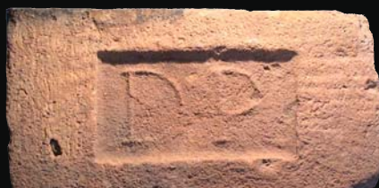
22. kép: mélyítésben domború DP (Drégelypalánk)